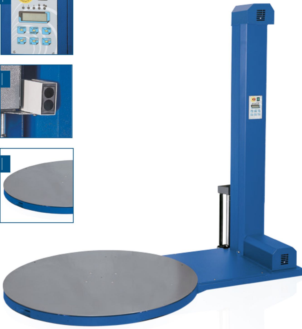
Платформний палетообмотувач TIRO

Малюнок призначений тільки для ознайомлення та може відрізнятися від зовнішнього вигляду обладнання, що постачається.